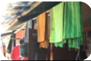
色鮮やかなタイス