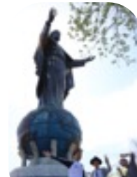
クリストレイ の大きさは約30m

観光名所の少ない東ティモールの唯一の観光地と呼ばれるクリストレイに行ってきました。世界第2位の大きさのキリスト像です。近辺の海はとても綺麗で、少し潜ると、サンゴ礁や色鮮やかな魚がたくさんいました。