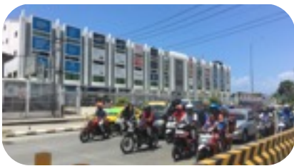
朝の通勤ラッシュと ショッピングモール

首都ディリは海に面しており、目の前に海が広がっている環境は海の近くに住んだことがない私にとって憧れの環境です。