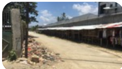
未舗装の道路、 捨てられたゴミ(左側)