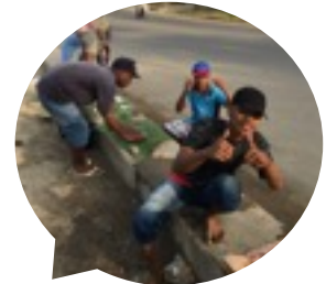
スマホを向けると喜んでポーズ

東ティモールに到着し、早くも1ヶ月が経とうとしています。 ここは私がイメージしていた途上国とは違い、モノは輸入品で何でも揃います。でも輸入品は日本と物価が変わりません。 今回は私がこれまでに感じた首都ディリについて紹介します。