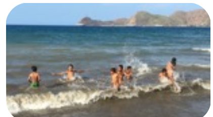
自然を相手に元気に遊ぶ 子ども達