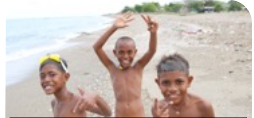
子どもたちの笑顔が最高

11月からは、いよいよ活動開始。配属先での活動と、一人暮らしの新生活が始まりました。