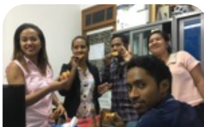
同僚は若い人が多い