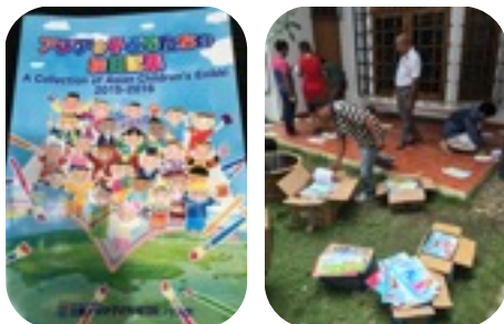
たくさんのエントリーと作品を選定している様子

私の配属先で、三菱アジア子ども絵日記フェスタのコンクールの入賞作品の審査会がありました。