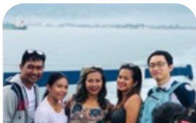
職場の同僚と行きました