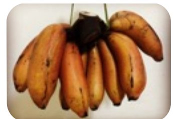
Hudi 赤色でいちご味と 言われている バナナ 1~2米ドルで買えます