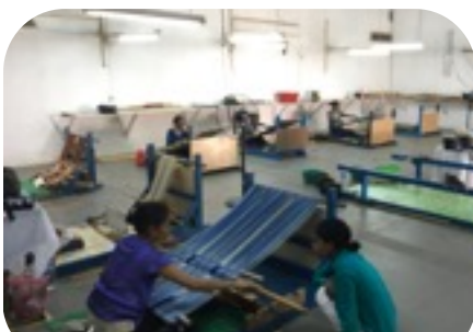
同じタイスでも何人もで効率よく作っているグループとベテランの職人が個人で作成しているグループ