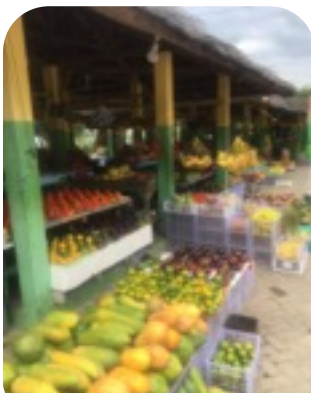
パパイヤなどの果物が たくさん並ぶ フルーツマーケット

東ティモールの季節は乾季と雨季があり、4月で去年の11月から続いた雨季が終わりとも言われています。この雨季の時期は海沿いにあるフルーツマーケット、庭になる果物が充実し、美味しい果物を安く味わうことができます。私のオススメの果物を紹介します。