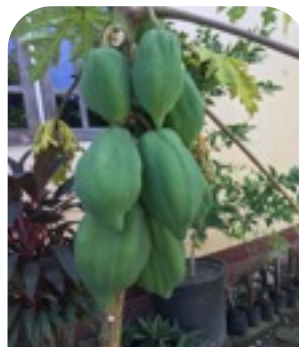
Ai-dila 幹が折れそうになる ぐらい垂れ下がる パパイヤ